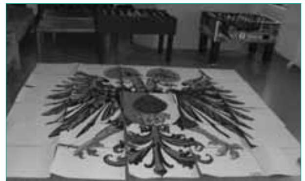
Vorbereitung einer Choreografie in den FP-Räumlichkeiten