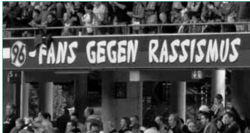
Die Aktionen gegen Rechtsextremismus werden in Hannover von einem breiten Fanbündnis getragen

Als Reaktion auf den immer größer werdenden Zulauf von Mädchen und Frauen im Stadion macht das Fanprojekt Hannover seit einigen Jahren spezielle Angebote für weibliche Fans, wie etwa Videoabende, Tischfußball-Turniere oder Selbstverteidigungskurse. Zu beobachten ist dabei jedoch immer wieder, dass die weiblichen Fans diese speziellen Angebote zwar gern annehmen, aber nicht von den männlichen Fans abgeschottet werden wollen, belegt auch durch die rege Teilnahme vieler Mädchen und Frauen an den U16-Fahrten zu Auswärtsspielen. Das ist leider im umgekehrten Fall nicht immer so. Die daraus resultierenden Konflikte können Anmache und sexistische Äußerungen gegen die weiblichen Fans sein. Dieses war u. a. auch ein Grund für den Einsatz einer weiblichen Mitarbeiterin im Fanprojekt mit der Zielsetzung, Mädchen in solchen Situa-