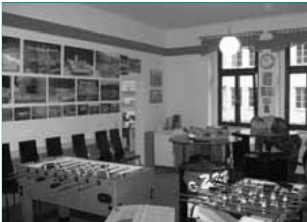
Die Räume des Fanprojekts

Seit der Gründung des Fanprojekts Zwickau e. V. am 2. Mai 1997 wurde, trotz der sportlichen Talfahrt des sächsischen Traditionsvereins FSV Zwickau e. V. von der 2. Bundesliga bis in die Niederungen der 5. Liga, die sozialpädagogische Betreuung der aktiven Anhängerschaft des Bezugsvereins durchgängig gewährleistet.