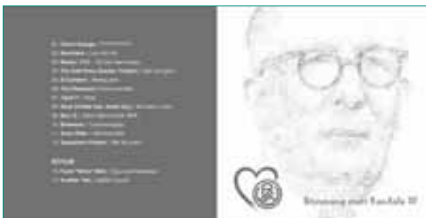
Stimmung statt Randale, CD-Cover

Last but not least soll nicht unerwähnt bleiben, dass das Fanprojekt, dank eines engagierten Fans, über eine eigene Homepage verfügt. Dadurch erhöht sich die Informationsdichte für die Fans von RWE. Gleichzeitig kann dadurch flexibel und unkompliziert auf kommende Veranstaltungen hingewiesen werden.