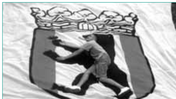
Berlin macht Spaß – Vorbereitung einer Choreografie

Darüber hinaus ist das Fanprojekt aktiver Mitgestalter des Umsetzungsprozesses zum Projekt Lernort Fußballstadion beim 1. FC Union. Im sogenannten Lernzentrum wird die Motivationskraft des Fußballs genutzt, um für bildungsferne Jugendliche das „Lernen“ auf ganz verschiedenen Ebenen attraktiv zu machen. Eine weitere Besonderheit stellt das pädagogische Engagement im Berliner Jugendfußball dar. Hier ist das Fanprojekt u. a. intensiv in Weiterbildungs- und Schulungsmaßnahmen des Berliner Fußball-Verbandes für Übungsleiter, Trainer und Ehrenamtliche zu den Themen Gewalt, Fairness und Toleranz eingebunden.