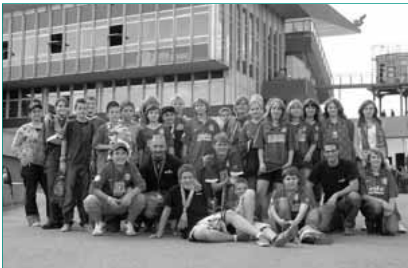
WSV-Teens beim Auswärtsspiel gegen Union Berlin

Besonders gut angenommen wird das vom Fanprojekt eröffnete Fanhaus 1954, das in Wuppertal etwas gänzlich Neues darstellt. Hier treffen sich junge und „alte“ Fans, Fanklubs und -gruppierungen. Gerade den Ultras kommt das großzügige Platzangebot entgegen, denn hier können sie Choreos planen und Fahnen anfertigen.