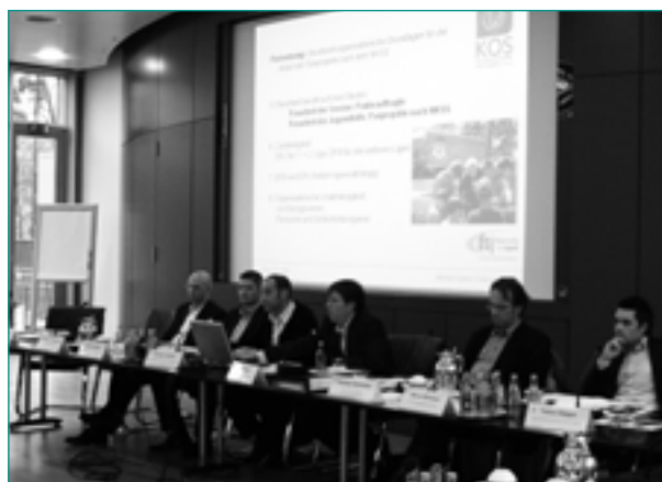
Gemeinsame Veranstaltung von DFB, DFL und KOS

Für viele jugendliche Fußballfans stellt der zwangsläufige Kontakt zur Polizei im Rahmen von Fußballspielen eine regelmäßige Erfahrung mit den Hütern des staatlichen Gewaltmonopols dar. Leider werden die Fanszenen vielerorts noch undifferenziert als Problemgruppe betrachtet und dementsprechend behandelt (z. B. sog. „wandernde Kessel“ vom Bahnhof zum Stadion und zurück), was zum Aufbau eines Feindbildes Polizei in Teilen der Fanszene beigetragen hat. Die Fanprojekte stellen fest: Je kommunikativer, transparenter und differenzierter die Einsätze durchgeführt werden, desto höher die Akzeptanz polizeilichen Eingreifens und ganz generell der Institution Polizei bei den Jugendlichen. Aus diesem Grunde hat die KOS im Rahmen der 11. Bundeskonferenz in Dresden einen Prozess angestoßen, der von den Fanprojekten und auch der Polizei positiv aufgenommen wurde und schließlich in einen strukturierten und kontinuierlichen lokalen Dialog zwischen Polizei und Fanprojekten münden soll. Neben der Einführung des Quali-