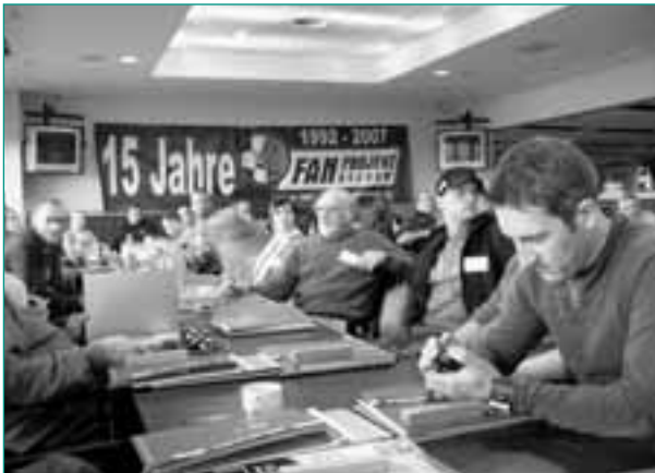
Bundesweite Tagung der Fanprojekte in Bochum

Fanprojekte leisten in den Städten wichtige Beiträge zur Jugendarbeit, da sie Treffpunkte und Freizeitaktivitäten anbieten und über das attraktive Medium Fußball auch Jugendliche einbinden, die von den Regeleinrichtungen nur schwer oder gar nicht erreicht werden können. Das darf jedoch nicht darüber hinwegtäuschen, dass die Realität der