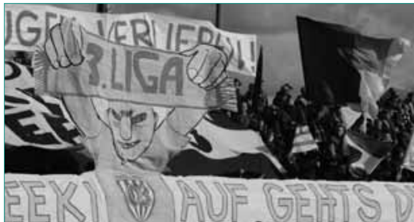
Aufwendige Choreografien gehören zum festen Repertoire der 03-Supporters

Die neue Ausgangssituation in Verbindung mit einer auch in Potsdam tendenziell der Gewalt offenstehenden Generation von Jugendlichen im Alter von 17 bis 20 Jahren und der insbesondere bei Auswärtsspielen in den alten Bundesländern (z. B. Emden und Ahlen) oft situativ unangemessenen Vorgehensweise der Polizei schaffte neue Herausforderungen, denen sich die Fansozialarbeit stellen musste. So kann der Sozialarbeiter des Fanprojekts mit wohlwollender Unterstützung der Geschäftsleitung des Diakonischen Werks neue Ansätze entwickeln und umsetzen: