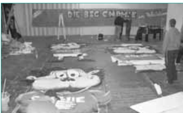
Vorbereitung einer Choreo im FP

Ein weiteres Standbein unserer Arbeit ist die individuell notwendige Einzelfallhilfe sowie das Ermöglichen von sportpädagogischen Angeboten. Zudem war und ist ein Schwerpunkt der Tätigkeit unter dem Dach des FP Leipzig die Mitarbeit im kriminalpräventiven Rat der Stadt Leipzig. Ein wesentlicher Punkt ist hierbei die Vernetzung und der Austausch mit verschiedenen Gremien, die im Zusammenhang mit Fußballspielen aktiv sind.