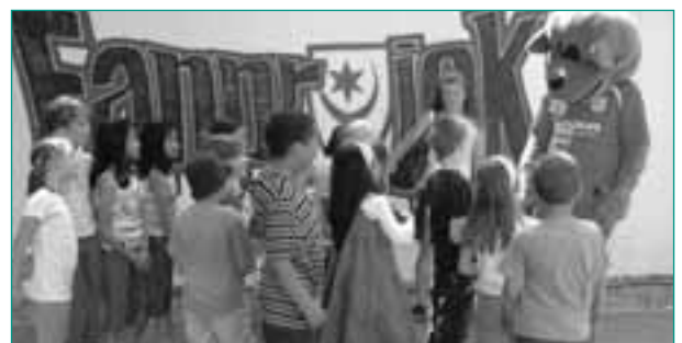
Kinderfest am Fanhaus

Darüber hinaus wird sich das Fanprojekt um die Anliegen aller Fans kümmern und möchte dabei ohne Besserwisserei und Kontrollabsichten ein verlässlicher Ansprechpartner sein, der sich für Faninteressen einsetzt. Im Fanhaus und in Einrichtungen kooperierender Institutionen werden Gesprächsmöglichkeiten, Treffs, Foren sowie Freizeit- und Bildungsangebote nach den Standards offener Jugendarbeit/Jugendsozialarbeit und generationsübergreifender Sozialarbeit offeriert.