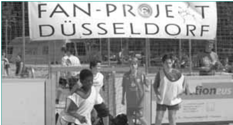
Streetkick-Angebot des Fanprojekts

Das Fanprojekt Düsseldorf nahm im September 1993 seine Tätigkeit auf. Träger des Projekts ist der Düsseldorfer Jugendring. Durch Spendengelder der Punkrock-Gruppe Die Toten Hosen wurde das Fanprojekt anfinanziert. Heute ist es eine anerkannte Größe in der Düsseldorfer Fan- und Jugendhilfelandchaft. Mit der pädagogischen Fanprojektarbeit sollen gewaltfreie Konfliktlösungen mithilfe von Selbstregulierungsmechanismen geschaffen werden und der Abbau extremistischer Orientierungen (Vorurteile, Feindbilder und Ausländerfeindlichkeit) unterstützt werden. Jugendliche Fans sollen die Möglichkeit erhalten, bei sie betreffenden Themen mitzubestimmen und Einfluss zu nehmen. Mittels gezielter Angebote und Aktionen wird der Fanszene ein Forum geboten, um sich gemeinsam auszutauschen und die Düsseldorfer Fankultur positiv weiterzuentwickeln.