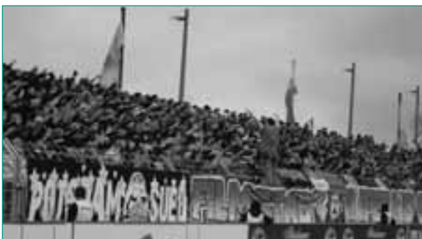
Fanblock der Babelsberger Anhänger

Der nach vierjähriger Oberligazugehörigkeit lang ersehnte Aufstieg in die drittklassige Regionalliga Nord 2007 hatte neben seiner sportlichen und wirtschaftlichen Bedeutung für den SV Babelsberg 03 auch den Begleiteffekt, auf eine stattliche Anzahl von Traditionsfußballvereinen aus der ehemaligen DDR-Oberliga und der alten BRD-Bundesliga zu treffen. Dabei verfügen Mannschaften wie Dynamo Dresden, 1. FC Magdeburg oder Eintracht Braunschweig nicht nur über große traditionelle Fanszenen, sondern eben auch über spezifische jugendliche Fansubkulturen mit teils gewaltorientiertem Habitus.