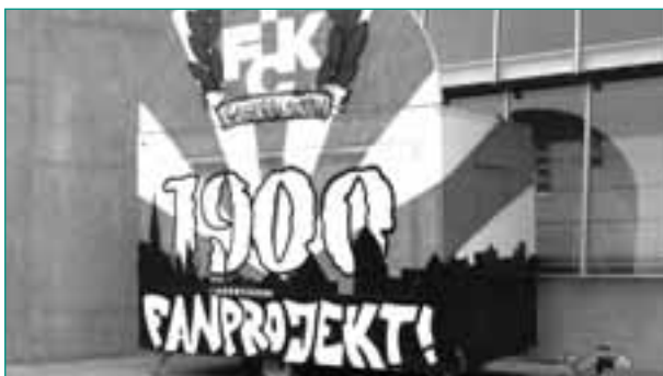
Treffpunkt im Stadion: der auffällig gestaltete Wagen des Fanprojekts

Neben den Spieltagen sind die Mitarbeiter/innen in den Räumlichkeiten des Fanprojekts anzutreffen und stehen dort auch nach Absprache für Einzelgespräche zur Verfügung. Die Räumlichkeiten des Fanprojekts bestehen neben Büro und Küche aus zwei zusammenhängenden Aufenthaltsräumen. Diese werden momentan noch mithilfe verschiedener aktiver Fans selbst gestaltet. In Zusammenhang mit dieser aktiven Beteiligung an der Gestaltung haben einige Fans einen Arbeitskreis Fanprojekt gegründet, der das Fanprojekt intensiv begleitet, Wünsche, Forderungen und Anliegen der Fans an das Fanprojekt heranträgt und im Gegenzug Positionen des Fanprojekts in die Fanszene weitergibt.