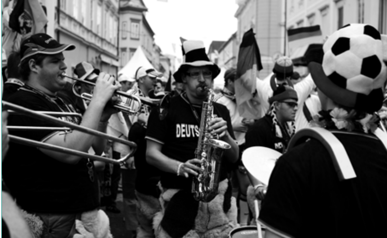
In Klagenfurt bei der Euro 2008

lokalen Fanprojekte oft durch viel zu hohe Erwartungen auf der einen und strukturelle Defizite und personelle Unterbesetzung auf der anderen Seite bestimmt wird. Es sind durchschnittlich weniger als zwei Hauptamtliche in den Fanprojekten angestellt, die es aber häufig mit Fanszenen zu tun haben, deren Zahl in die Tausende geht. An dieser Stelle gibt es also noch deutlichen Entwicklungsbedarf, zumal das 1993 eingeführte Nationale Konzept Sport und Sicherheit (NKSS) modellhaft von drei hauptamtlichen Fachkräften für ein Fanprojekt ausgeht.