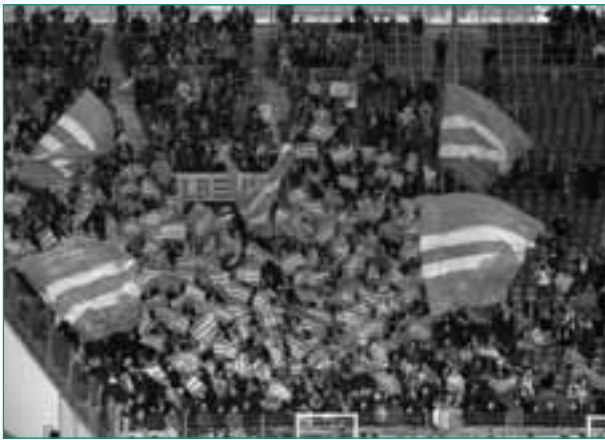
Die Rostocker Anhänger auswärts in Stuttgart