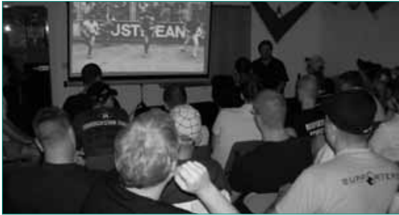
Eine Abendveranstaltung in den Räumen des Fanprojekts

Das Fanprojekt Chemnitz ist offiziell seit dem 1. Juli 2007 am Start, Grundlage der inhaltlichen Arbeit ist das Nationale Konzept Sport und Sicherheit (NKSS). In der Startphase des Projektes wurde besonderer Wert darauf gelegt, die Bedürfnisse und Problemlagen der örtlichen Fußballanhänger zu erfahren und zu analysieren. Dies geschieht durch tägliche Gespräche mit Fans, aber auch mit Repräsentanten der Fanszene, die sich einmal im Monat in einem Fanarbeitskreis treffen. Durch eine solide Anschubfinanzierung von Stadt, Land und DFB konnte im Bereich Ausstattung für einen guten Grundstock gesorgt werden, mit dem sich in der pädagogischen Arbeit flexibel mit jugendlichen Fußballfans agieren lässt.