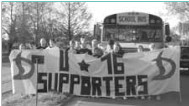
U16-Projekt on Tour!

Das Fanprojekt Dresden wurde im März 2003 neu gegründet. Begann man anfangs mit ausschließlich ehrenamtlichen Kräften und noch geringer finanzieller Unterstützung der Stadt und des Vereins Dynamo Dresden das Fanprojekt aufzubauen, so hat sich das Projekt in den vergangenen Jahren immer stärker professionalisiert und zum größten sächsischen Fanprojekt entwickelt. Möglich wurde dies durch die Erhöhung der Geldmittel vonseiten der Stadt Dresden im Januar 2005 und die Förderung durch den Freistaat Sachsen ab Oktober 2005 als Modellprojekt. Damit konnte das Fanprojekt Dresden nach den Vorgaben des Nationalen Konzepts Sport und Sicherheit (NKSS) mit der Drittelfinanzierung durch Kommune, Land und – da der Verein zu dieser Zeit in der 2. Liga spielte – DFL arbeiten. Weil die Modellprojektfinanzierung zeitlich befristet war und am 31. Dezember 2007 auslief, musste leider ein Mitarbeiter entlassen werden. Im Jahr 2008 bekannte der Freistaat Sachsen sich endlich grundsätzlich zu seiner landesweiten Verantwortung, sozialpädagogische Fanprojektarbeit finanziell zu fördern. Durch die Bereitstellung dieser Mittel sowie der zusätzlichen Förderung durch den DFB