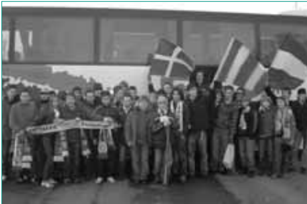
U18-Tour des Fanprojekts Bochum

Seit 1992 ist das Bochumer Fanprojekt als erstes Modell einer Trägerkooperation der Arbeiterwohlfahrt mit dem Jugendamt (Streetwork) der Stadt Bochum aktiv. Die erste Bundeskonferenz der Fanprojekte fand 1993 in Bochum statt. Hierbei stand die Zaun-Debatte verbunden mit der Forderung nach einem Rückbau der „Spielumfriedungen“ im Mittelpunkt der Diskussionen. Aus der „Käfighaltung“ sollte so ein für die Zuschauer gastfreundlicherer Aufenthaltsort werden. Damals noch unverstanden und belächelt, hat sich diese Initiative aus den Reihen der Fanprojekte als äußerst zukunftsorientiert erwiesen – abzulesen an der Zahl der Stadien, in denen der Zaun mittlerweile gefallen ist.