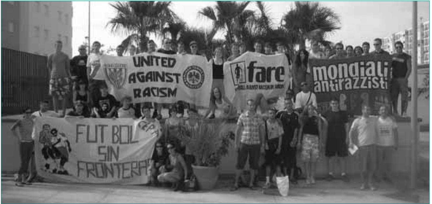
Jugendbegegnung in Cadix – Beteiligung von Berliner Fans dank dem FP Berlin

D as Fanprojekt Berlin wurde 1990 mit Unterstützung des Landes Berlin eingerichtet und befindet sich in Trägerschaft der Sportjugend im Landessportbund Berlin e. V. Das Projekt wird aktuell aus Mitteln der Senatsverwaltung für Bildung, Wissenschaft und Forschung und Geldern der Deutschen Fußball-Liga und des Deutschen Fußball-Bundes gemäß den Bestimmungen des Nationalen Konzepts Sport und Sicherheit finanziert. Darüber hinaus erhält das Projekt für die Beschäftigung von Jugendlichen im Freiwilligen Sozialen Jahr eine finanzielle Förderung durch das Bundesamt für Zivildienst.