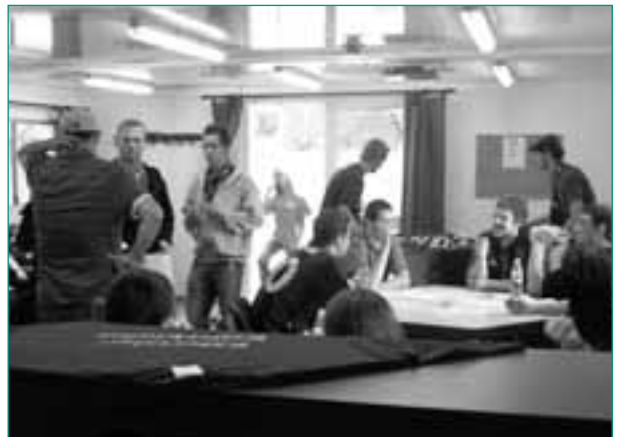
Das neue Fancafé wird von den Fans gut besucht

In den Monaten vor dem Saisonstart 2008/2009 allerdings stand neben klassischer Fanprojekttätigkeit wie der Begleitung von Auswärtsfahrten vor allem eine eigentlich eher fachfremde Arbeit auf dem Plan. Zum Start der neuen Saison wurde der Fantreff eingerichtet und dabei sehr viel selbst mit Hand angelegt. Es gab allerhand zu tun und zum Ausbuddeln von Gräben für die Wasser- und Stromlei-