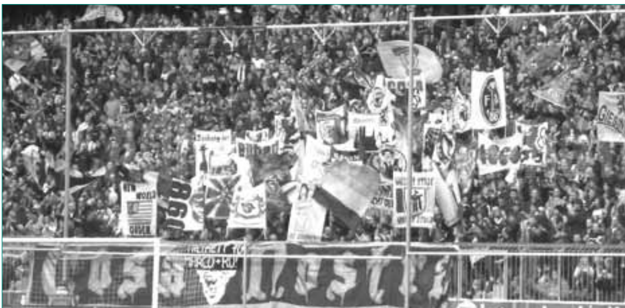
Die Fans der Blauen Foto: DER (PF) LÄSTERSTEIN

Die in der Vergangenheit getroffene Personalentscheidung der beiden Vereine, je einen Fanbeauftragten für die Betreuung „unorganisierter“ Fans einzustellen, hatte zur Folge, dass ein regelmäßiger Informationsaustausch und eine offene, faire und konstruktive Zusammenarbeit zwischen Fanprojekt und den Vereinen stattfindet. Durch verstärkte Aufklärungsarbeit bei den Ultras vom TSV 1860 ist es gelungen, einen engen Kontakt zwischen der Cosa Nostra (CN) und den Löwenfans gegen Rechts (LGR) herzu-