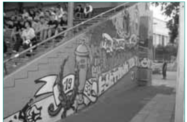
Fanprojekt-Graffiti im Flinger Broich

Neue Wege geht das Fanprojekt immer in den Sommerferien. Dann beteiligt es sich in der letzten Ferienwoche in Nordrhein-Westfalen am Olympic-Adventure-Camp , einem attraktiven Ferienprogramm für Kinder und Jugendliche am Düsseldorfer Rheinufer. Dort können die Besucher täglich über 40 Kampf-, Trend- und Funsportarten ausprobieren. Es handelt sich um eine Veranstaltung des Jugend- und Sportamts, bei der das Fanprojekt als Kooperationspartner auftritt und neben dem losen Fußballkick mehrere Streetsoccer-Turniere organisiert. Gemeinsam mit den anderen Fanprojekten in NRW organisiert das Fanprojekt zudem die jährlich stattfindende NRW-Streetsoccer-Tour . Um den integrativen und antirassistischen Grundgedanken des Fußballs auszudrücken, bestehen die meisten Teams dabei aus Spielern unterschiedlicher Nationen. Ein weiteres Standbein der Fanprojektarbeit sind Schulpartnerschaften. Die Mitarbeiter/innen gehen an Schulen und führen Coolness- bzw. Antigewalt-Trainings mit abenteuerpädagogischen Elementen durch.