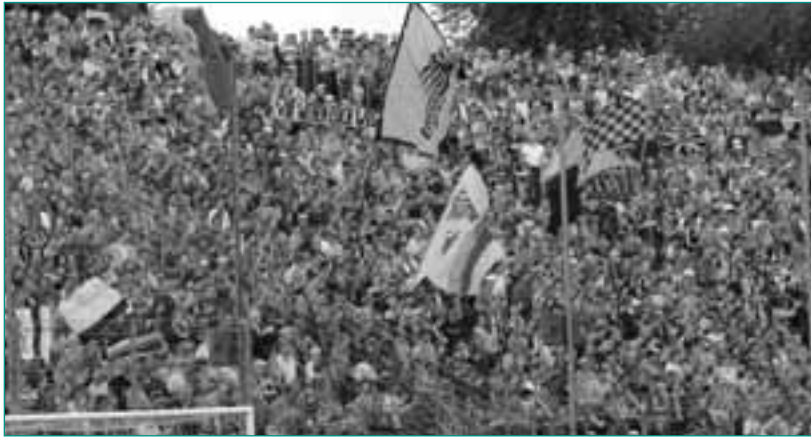
Fankurve im ehrwürdigen Tivoli

Die Fanszene des traditionsreichen TSV Alemannia Aachen ist ein fester Bestandteil der deutschen Fankultur und wirkt weit über die Stadt- und Landesgrenzen hinaus. Die besondere Lage der Stadt im Länderdreieck Belgien-Niederlande-Deutschland bringt zudem noch einige fanspezifische Eigenarten mit sich.