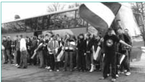
U16-Fahrten des Fanprojekts machen Spaß

In einer interdisziplinären Arbeitsgruppe mit allen am Fußball beteiligten Institutionen wird gemeinsam gegen rechte Tendenzen in der Fanszene vorgegangen. So werden Angebote gemacht, die zum Ziel haben, die demokratischen Kräfte in der Fanszene zu fördern und zu stärken. Ein Beispiel ist die Gründung des Arbeitskreises 96-Fans gegen Rassismus , der im Oktober 2004 aus der Fanszene heraus entstand und vom Fanprojekt begleitet wird. Dieser Arbeitskreis führte mit Infoveranstaltungen im Stadion, T-Shirts und Schals gegen Rassismus, einer fest installierten Bande im Stadion mit der Aufschrift 96-Fans gegen Rassismus , einer Choreografie und Rockkonzerten gegen Rassismus eine Reihe bemerkenswerter Aktionen durch.