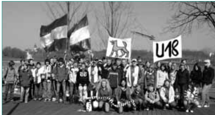
U18-Fahrten sind beim Wolfsburger Anhang sehr beliebt

Das Fanprojekt ist stets bemüht, sich vorausschauend Gedanken über die Entwicklung der Fanszene zu machen, damit die kreative, bunte, selbstverantwortlich handelnde und fröhliche Fußballkultur Bestand hat. Die wichtigsten Partner des Projekts sind die Fans des VfL Wolfsburg, die VfL Wolfsburg Fußball GmbH, die Polizei Wolfsburg, die KOS und die Bundesarbeitsgemeinschaft Fanprojekte (BAG). Zusammen mit diesen Partnern haben wir das Projekt Wir schauen hin! ins Leben gerufen. Gemeinsam wollen wir bei Themen wie Rassismus, Gewalt oder Alkoholmissbrauch eine grundlegende Sensibilisierung zum Hinschauen und zur Übernahme von Verantwortung aller am Fußballgeschehen beteiligter Menschen erreichen. Das Projekt soll Kinder und Teenies ab acht Jahren, Jugendliche und junge erwachsene Fußballfans dabei unterstützen, eine gefestigte Persönlichkeitsstruktur zu entwickeln, und es dem Ordnungs- und Sicherheitspersonal ermöglichen, ihr Handeln zu reflektieren und zu professionalisieren.