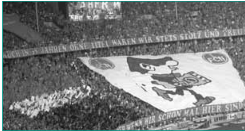
Die Nürnberger Ultraszene gehört zu den größten in Deutschland

So ist das Fanprojekt, trotz aller vor allem finanzieller Widrigkeiten, nach wie vor Garant einer stetigen Beziehungs- und Kommunikationsarbeit mit den relevanten Hooligan- und Ultragruppen mit den hierzu zählenden Einzelhilfen, Beratungsangeboten, Vermittlungsgesprächen und sozialer Gruppenarbeit. Auch in Nürnberg stehen seit einigen Jahren die Ultras verstärkt im Blickpunkt, was sich auch auf die Arbeit des Fanprojekts ausgewirkt hat. Daneben hat das Fanprojekt über strukturelle Initiativen in Richtung 1. FC Nürnberg den unzähligen Fanklubs zu einer angemessenen