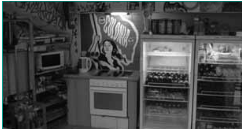
Auch eine kleine Küche kann im FP genutzt werden

mus zu aktivieren. Die elf sozialpädagogischen Fanprojekte des Bundeslandes unterstreichen darüber hinaus die Stärke ihres Netzwerkes.