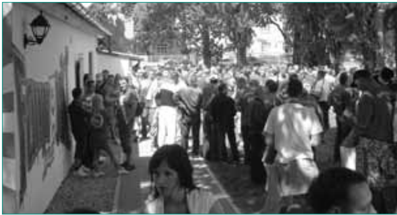
Das Fanhaus, Treffpunkt am Spieltag

B ereits Anfang der 90er-Jahre gab es ein Fanprojekt in Halle an der Saale, und auf Initiative des ehrenamtlichen Fanrates mit Unterstützung des Halleschen FC wurde im Juni 2005 gegenüber der Stadt Halle der dringende Bedarf sozialpädagogischer Fanarbeit neu formuliert. Daraufhin wurde innerhalb des Fachbereiches Kinder, Jugend und Familie der Stadt Halle/Saale eine Arbeitsgruppe für die konzeptionelle Entwicklung eines Fanprojekts gebildet, das am 5. November 2006 mit Übergabe der Förderbescheide des Landes Sachsen-Anhalt und des DFB in kommunaler Trägerschaft der Stadt mit 1,5 Personalstellen offiziell gestartet wurde.