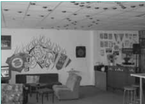
Die neuen Räumlichkeiten bieten noch mehr Möglichkeiten

Das Fanprojekt in Aue gibt es seit Juni 1996. In den ersten zehn Jahren war die Situation von denkbar schlechten strukturellen Rahmenbedingungen und einer sehr geringen finanziellen Unterstützung geprägt, sodass die Arbeit zu meist nur auf ehrenamtlicher Basis geleistet werden konnte. Doch seit 2005 geht es aufwärts: Im dritten Jahr des FC Erzgebirge Aue in der 2. Liga wurde auf städtischer Seite endlich die Notwendigkeit einer kontinuierlichen professionellen Arbeit anerkannt. Eine ausgewiesene Streetworker-Planstelle in der Trägerschaft des Kreisjugendrings Erzgebirge e. V. wurde dem Fanprojekt zugewiesen.