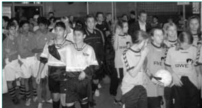
Kick racism out – Turnier 2008

Auf der anderen Seite geht es in der Arbeit des Fanprojekts längst nicht nur um die negativen Aspekte des Fußballs. Fans werden in ihrem Leben und ihrer Alltagskultur unterstützt. Der Kontakt zum Verein wird verbessert, der aus der Fanszene selbst organisierte Fanrat vom Fanprojekt begleitet. Beispiel hierfür ist die Produktion einer Musik-CD von Rockbands, die aus der Fanszene kommen, unter dem Motto Stimmung statt Randale , 2008 erschien die dritte CD in dieser Reihe. Regelmäßige Aufgaben des Fanprojekts sind die Begleitung der Fans zu allen Auswärtsspielen, oft in Kombination mit mehrtägigen Jugendfreizeiten, internationale Jugendbegegnungen, die Begleitung des Fanprojekt-Fußballteams und die Unterhaltung des Fan-Containers Westkurve.