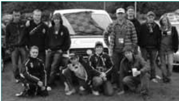
Die FP-Mitarbeiter und Teilnehmer/innen einer U18-Fahrt