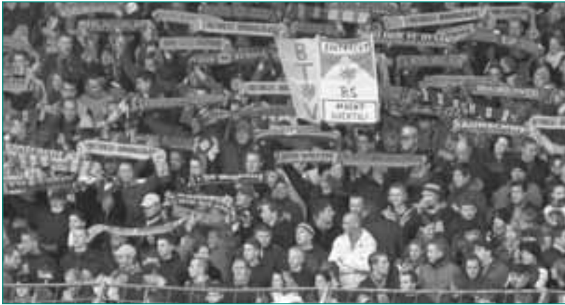
Schalparade in der Braunschweiger Fankurve