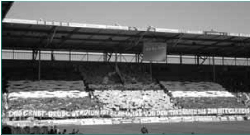
Das neue Stadion wurde von den Fans gut angenommen

Der 1. FC Magdeburg stellt für viele Jugendliche der Region aber auch darüber hinaus ein starkes Identifikationsobjekt dar, wie nicht zuletzt die hohen Zuschauerzahlen der letzten Jahre und die wachsende Anzahl junger aktiver Fans bestätigen. Die Fanszene hat sich durch die zeitweise Oberligazugehörigkeit zwar stark verändert, der Selbstorganisationsgrad unter den aktiven Fans ist jedoch immer noch sehr hoch.