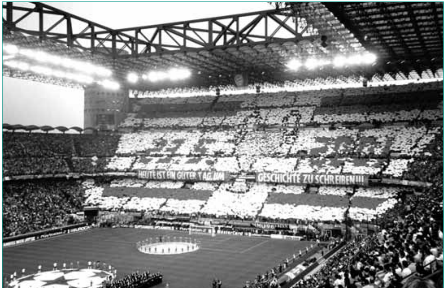
Eine „Choreo“ der Roten

stellen. Die CN, die sich als unpolitische Ultragruppierung versteht, arbeitet nun eng mit den LGR zusammen, wenn es um gemeinsame antirassistische Aktionen geht.