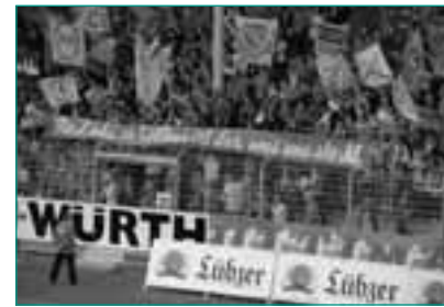
Im Stadion der Freundschaft herrscht eine besondere Atmosphäre

Dies ist umso bedeutender, da latent vorhandene rechtsorientierte Einstellungen in der Cottbuser Fanszene keinen Fuß fassen sollen. Eine wichtige Aufgabe für das Fanprojekt stellt in diesem Zusammenhang auch die Beratung und weitere Sensibilisierung des FC Energie Cottbus für diese Problematik dar.