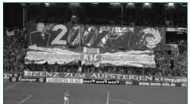
Die Karlsruher Ultraszene gehört zu den stilbildenden Szenen Deutschlands