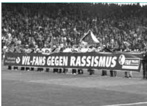
Ein zentrales Thema und Anliegen der Fanprojektarbeit

Seit dem Report Fanprojekte 2007 – Sachbericht zum Stand der sozialen Arbeit mit Fußballfans sind mit dieser Ausgabe die Standorte Aachen, Augsburg, Braunschweig, Chemnitz, Kaiserslautern, Lübeck, Magdeburg, Rostock und Zwickau neu hinzugekommen. Ein Beleg dafür, wie anerkannt der Arbeitsansatz der Fanprojekte mittlerweile ist. Mit dem Bundesland Sachsen ist im Jahre 2008 ein ehemaliges „Sorgenkind“ in den Kreis der Förderer der Fanprojekte eingetreten. Durch dessen langfristige Förderzusagen konnten die schon bestehenden Fanprojekte in Dresden, Aue, Chemnitz und Leipzig stabilisiert sowie das Fanprojekt Zwickau wieder in den Sachbericht aufgenommen werden. Letzteres freut uns bei der KOS aufrichtig, hat doch in Zwickau der Vorstand