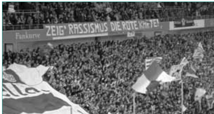
Fankurve der MSV-Fans

Zudem hat das Fanprojekt für interessierte Jugendliche und Erwachsene eine Sporthalle angemietet, in der regelmäßig Trainings und Freundschaftsspiele abgehalten werden können. Da sich viele NRW-Fanprojekte in unmittelbarer Nähe befinden, kommt es unabhängig von Ligazuge-