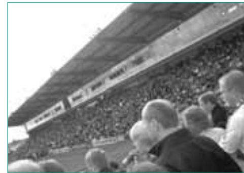
Auf der Lohmühle trifft sich Tradition und Moderne

Nachdem bereits in den Jahren 2001 bis 2003 in Lübeck ein Fanprojekt unter Trägerschaft der AWO bestand, konnte trotz erfolgreicher Arbeit mit den Lübecker Fans und der sich entwickelnden Ultra-szene keine Anschlussfinanzierung durch das Land Schleswig-Holstein gesichert werden.