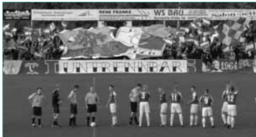
Kurvenbild vom Spiel Chemie Leipzig – Böhlitz Ehrenberg III

Da ein sportliches Aufeinandertreffen durch die Ligazugehörigkeit aktuell ausgeschlossen ist, wird die Rivalität der beiden Bezugsvereine zu Lok Leipzig meist im Alltag ausgelebt. Hierbei spielen politische Ausrichtungen der verfeindeten Gruppen eine wesentliche Rolle. Die Zielgruppe war und ist die aktive Fanszene des FC Sachsen Leipzig, sprich die Ultras. Seit einiger Zeit entwickelten sich aber