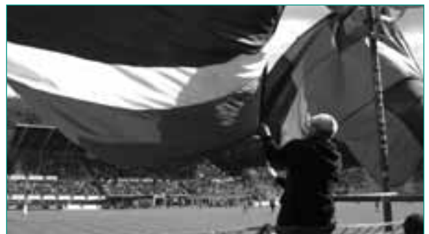
Auch in der derzeit 5. Liga vermag der FCS noch zahlreiche Anhänger zu mobilisieren

Das Fanprojekt Saarbrücken steht derzeit an einem Scheideweg. Gelingt es nicht, das Fanprojekt auf der Basis von 1,5 Stellen zu realisieren, so wird die Tätigkeit eingestellt werden müssen und das Saarland in Zukunft keine qualifizierte jugendbezogene soziale Fanarbeit mehr vorweisen können.