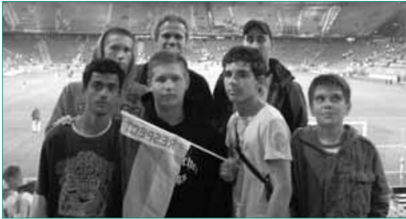
U16-EM-Tour des Fanprojekts zur Euro 2008

Unter der Trägerschaft des Internationalen Bundes arbeiten zwei hauptamtliche Mitarbeiter/innen: Antje Hagel und Bernd Giring teilten sich in der Saison 2007/2008 43,5 Wochenstunden. Hinzu kam eine Honorarkraft mit 10 Stunden und drei ehrenamtliche Helfer, die das Projekt unterstützten.