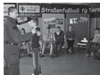
Außergewöhnlicher Lernort Fußballstadion