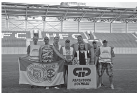
Fanprojekt koordiniert Stadionbaustellenbewachung durch HFC-Fans.