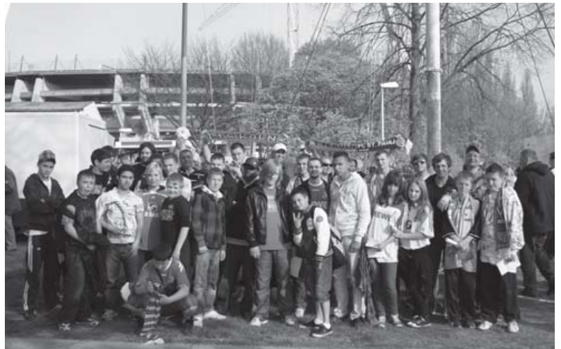
U16-Fahrt nach Bremen

Im Jahre 2011 hat das Fanprojekt gemeinsam mit seinem Träger Jugendzentren Köln gGmbH den Aufbau der Fußballliga Kick Fair Köln – Fußball ohne Schiedsrichter initiiert. Fair Play auf und neben dem Platz stehen hier im Vordergrund. Die teilnehmenden Jugendlichen verhandeln selbstständig die Fair-Play-Regeln, überwachen gemeinsam deren Einhaltung und beschließen anschließend, was zusätzlich zum sportlichen Erfolg in das Endergebnis einfließt. Die Jugendlichen lernen an diesen Erfahrungen, Konflikte gewaltfrei zu lösen, Regeln gemeinsam zu vereinbaren und einzuhalten. Aus der besonderen Spielweise lassen sich Lerninhalte und Themenfelder wie Toleranz, Respekt, Dialogfähigkeit, inter-