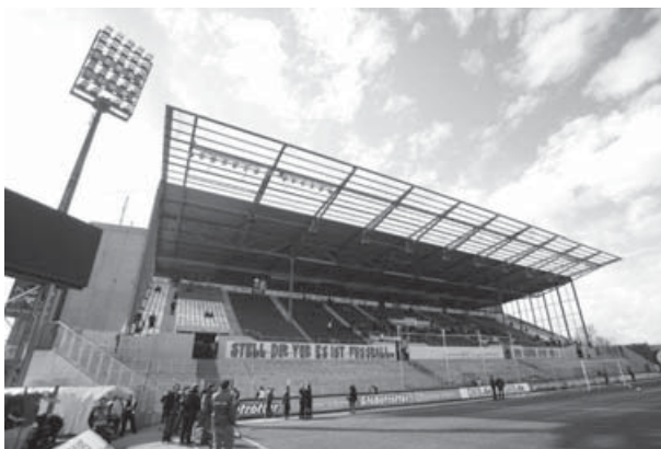
Boycott der Südtribüne beim Spiel gegen Hansa Rostock im März 2010