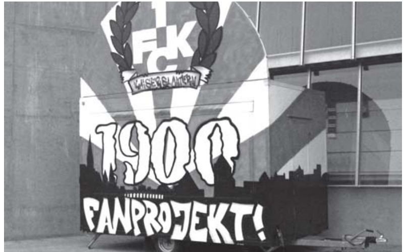
Treffpunkt im Stadion: der auffällig gestaltete Wagen des Fanprojekts

Die Angebote des Fanprojekts stehen jedem offen. Die