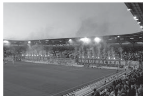
Genehmigte Pyroshow beim Eröffnungsspiel

Das Fanprojekt Halle startete im November 2006 in kommunaler Trägerschaft, nachdem der ehrenamtliche Fanrat mit Unterstützung des Halleschen FC im Juni 2005 gegenüber der Stadt Halle den dringenden Bedarf für eine sozialpädagogische Fanarbeit formulierte hatte. Noch vor dem Start wurde mit Unterstützung der ARGE und des Eigenbetriebs für Arbeitsförderung der Stadt mit der Sanierung eines Gebäudes in unmittelbarer Stadionnähe begonnen. Dieses Objekt wurde durch zehn HFC-Anhänger – im Rahmen einer Entgeltmaßnahme und mit ehrenamtlicher Unterstützung zahlreicher Fanklubs und Sponsoren – zu einer Anlauf- und Beratungsstelle für die Fans umgestaltet. Mit dieser vielbeachteten Aktion konnte sich das Fanprojekt in der Fanszene positionieren. Das Fanhaus hat sich zum zentralen Treffpunkt der HFC-Anhänger entwickelt.