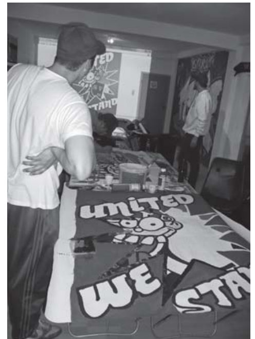
Bannermalen im Fanprojekt

Von großer Bedeutung ist die Institutionen- und Öffentlichkeitsarbeit. Hierzu zählen Austausch mit anderen Fanprojekten und Einrichtungen der örtlichen Jugendhilfe ebenso wie die Kommunikation mit Polizei und Verein. Als Lobbyist für jugendliche Fußballfans versucht das Fanprojekt durch gezielte Öffentlichkeitsarbeit, das Interesse für jugendliche Probleme und Bedürfnisse zu wecken.