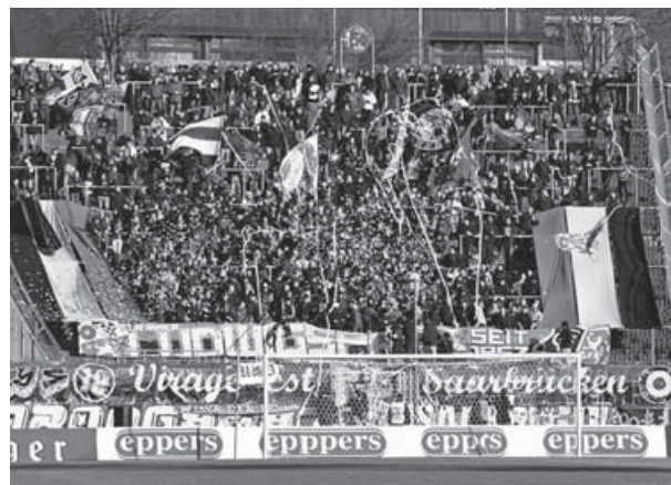
Derzeit spielt der FCS in der dritten Liga und mobilisiert auch dort zahlreiche Anhänger, hier in der Fankurve „Virage Est“.