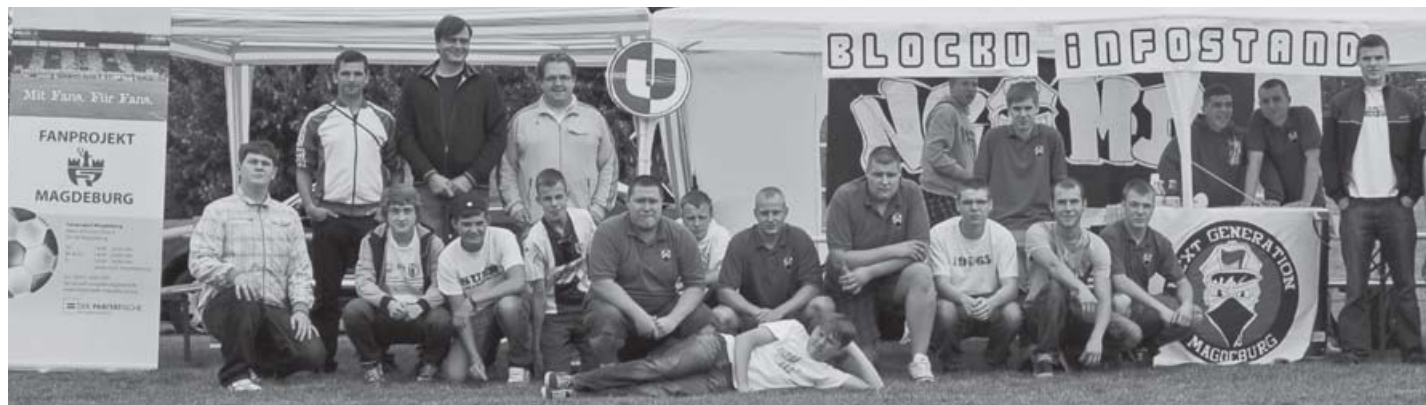
Fanprojekt und Magdeburger Ultras beim „Tag der Jugend“ der Kinder- und Jugendhäuser der Stadt Magdeburg