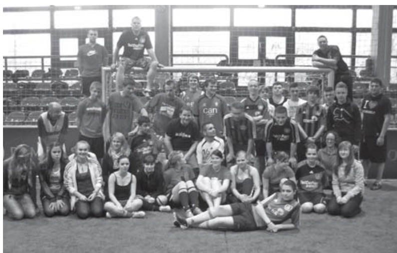
Auch sportliche Angebote gehören zur Fanprojektarbeit.

Das Fanprojekt Leverkusen ist seit vielen Jahren aufgrund seines Wirkens im Rahmen der Jugendsozialarbeit für die Leverkusener Fußballanhänger ein wichtiger und unverzichtbarer Bestandteil im Umfeld von Bayer 04 Leverkusen.