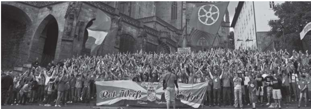
Derbymarsch im Juli 2011

Zehn Jahre lang wurde in Thüringens Landeshauptstadt über hauptamtliche sozialpädagogische Fanarbeit diskutiert, doch immer wieder scheiterte das Projekt an fehlenden Geldern. Auch im Frühjahr 2010 stand die Einrichtung des Fanprojekts Erfurt noch auf der Kippe, bis der gebürtige Erfurter und heutige Werder-Profi Clemens Fritz, 10.000 Euro aus seiner Stiftung spendete. Durch diese Anschubfinanzierung konnte das Fanprojekt Erfurt zum 1. Juli 2010 ins Leben gerufen werden. Träger des Fanprojekts ist der Verein PERSPEKTIV e. V., der seit 1991 als freier Träger der Jugendhilfe in Erfurt tätig ist.