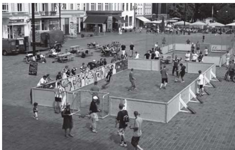
Die selbstgebaute Streetsocceranlage im Spielbetrieb

Die aktive Fanszene des F.C. Hansa Rostock e. V. zählt deutschlandweit zu einer der größten und vielerlei Hinsicht auch auffälligsten. In einem hohen Maße selbstorganisiert und klar ultradominiert, findet am Standort ein stetiger Prozess der Verselbstständigung statt. Teilweise mit in Eigenregie durchgeführten Sonderzügen unterwegs, reisen regelmäßig mehrere tausend Fans quer durch Deutschland zu den Auswärtsspielen. Anlassbezogen nimmt das Fanprojekt hier eine Vermittlerrolle bei Konflikten mit verschiedenen Institutionen und Behörden (Ordnungsdienst, Polizei usw.) ein. Die Spieltagsbetreuung ist daher ein wesentlicher Bestandteil der Arbeit.