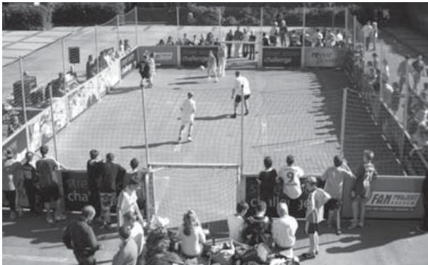
Straßenfußballturnier des Fanprojekts