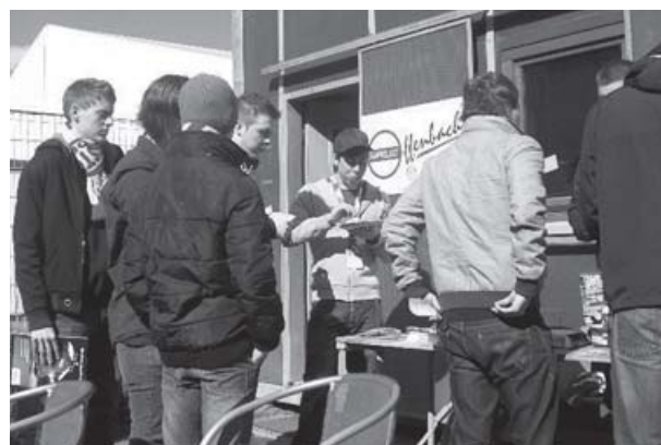
Während der Bauphase des neuen Stadions an neuer Stelle: der Container des Fanprojekts

Aktiv teilnehmend beobachtet das Fanprojekt die Entwicklungen der Fanszene. Hier gibt es durch das Fehlen von Ultrastrukturen in Offenbach einen großen Diskussionsbedarf rund um die Frage der Integration neuer und jüngerer Fans in die gewachsenen und von immer mehr als traditionalistisch empfundenen Fanstrukturen auf dem Bieberer Berg. Die Entwicklung der Boys Offenbach, einer großen Gruppe aktiver junger Fans, die es zum aktuellen Zeitpunkt schon nicht mehr gibt, haben die Mitarbeiter/innen des Fanprojekts Offenbach aktiv begleitet und moderiert. Zukünftig wird das Fanprojekt Offenbach in den neuerlichen Prozess der Selbstorganisation der Offenbacher Fanszene und die Orientierung im neuen Stadion viel Kraft und Aufmerksamkeit investieren.