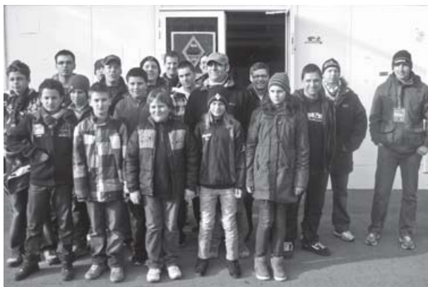
Die Waldhof-AG zu Gast im Fancafé

Die Geschichte des Fanprojekts begann genau genommen 1983 in Ludwigshafen, als die Stadt einen Streetworker zur Betreuung der Mannheimer Anhänger abstellte – Waldhof war seinerzeit in die Bundesliga aufgestiegen und trug seine Heimspiele auf der anderen Seite des Rheins in Ludwigshafen aus. Auch in Mannheim gab es zwischen 1986 und 1991 eine Art Vorläuferprojekt, erst im Jahr 2006 wurde dann ein vielversprechender Neuanfang gemacht.