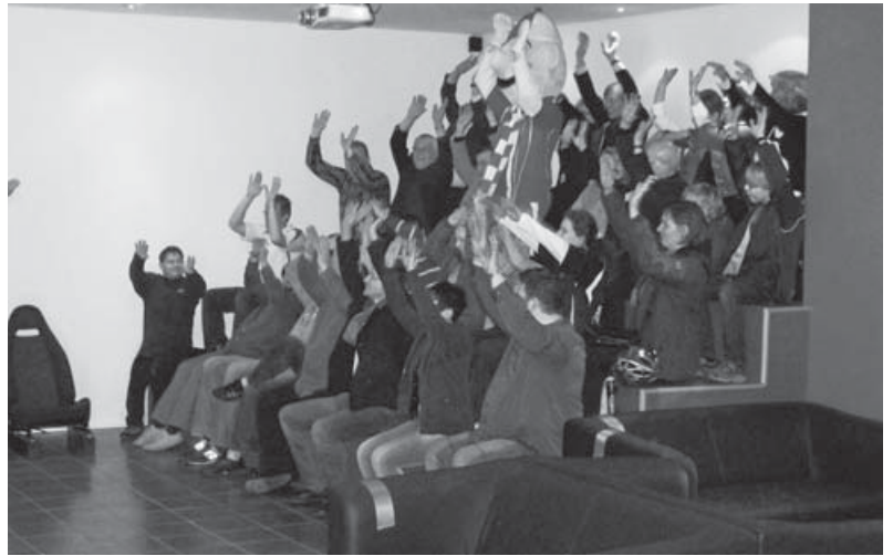
Public Viewing im Fanprojekt

Mit der Fertigstellung des im Besitz des Trägervereins befindlichen Strombadgeländes haben sich neue Ressourcen für die sozialpädagogische Fanarbeit ergeben. Auf der BAG-Jahrestagung der Fanprojekte im Jahr 2009 konnte das Gelände mit seinen vielfältigen Nutzungsmöglichkeiten