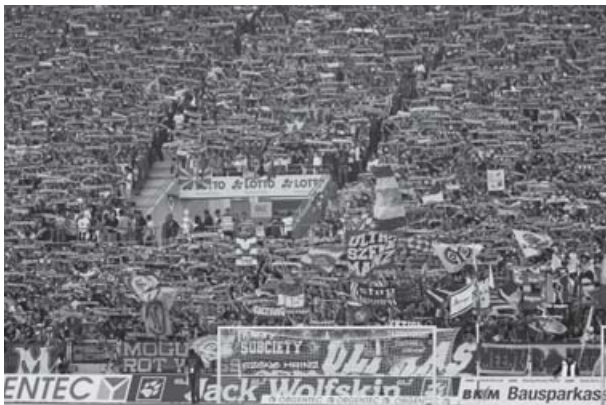
Der Stehplatzbereich im neuen Stadion

Das 1994 gegründete Fanprojekt in Mainz stellt strukturell ein ausgetüfteltes Konstrukt unter Beteiligung verschiedener Institutionen dar. Hierbei haben sich insbesondere die Gewerkschaften äußerst positiv hervor getan, von denen die Initiative zur Einrichtung ausging und die bis heute die Arbeit unterstützen. Zurzeit ist das Projekt mit drei Vollzeitstellen, einer Halbtagsstelle sowie einer Honorarkraft besetzt.