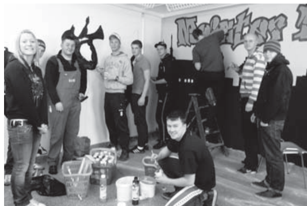
Fans gestalten neue Fanprojekträumlichkeiten.

„Repräsentativ-Beirat“, der das Fanprojekt gesellschaftlich und institutionell in der Stadt verankert.