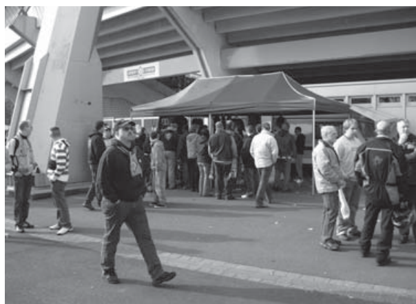
Infostand im Stadion

Neben der Begleitung von Fangruppen bei Heim- und Auswärtsspielen und der Rolle als Ansprechpartner für Fans in besonderen Problemlagen ist die Lösung von Konflikten, die im Rahmen des Spielbetriebes immer wieder entstehen, die Basis der Arbeit des Fanprojekts. Das vom Fanprojekt initiierte und betreute Fanradio hat inzwischen einen hohen Stellenwert in der Region erlangt. Dank der Kooperation mit Radio Ockerwelle wird ein hohes technisches und inhaltliches Niveau erreicht, was besonders für die Motivation der Jugendlichen eine große Rolle spielt. Die Fanzeitung 1895 wird inzwischen an jedem Heimspieltag sehnsüchtig erwartet. Hier schreiben Fans für Fans. Koordination, Redaktionsleitung und Organisation sowie Finanzierung liegen in den Händen des Fanprojekts. Zudem wird derzeit eine FanHochSchule im Rahmen des Projekts Lernort Stadion konzipiert, finanziert von der Robert Bosch Stiftung und der Bundesliga-Stiftung.