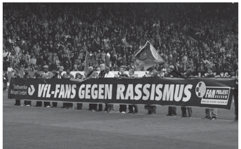
Teil der Präventionsarbeit: antirassistische Aktivitäten

Die beschriebene Projektorientierung des Bochumer Fanprojekts stellt in Verbindung mit dem Social Sponsoring der Kooperationspartner gerade in Zeiten leerer öffentlicher Kassen eine gute Chance für die Umsetzung wichtiger pädagogischer Initiativen dar.