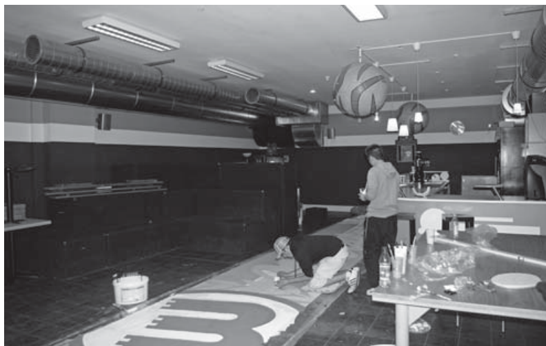
Eine Choreo wird vorbereitet.