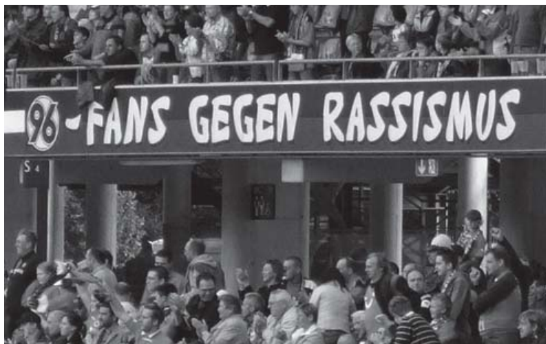
Die Aktionen gegen Rechtsextremismus werden in Hannover von einem breiten Fanbündnis getragen.

Das Fanprojekt Hannover besteht bereits seit April 1985 und ist als Einrichtung in Trägerschaft der Stadt Hannover intensiv in die kommunale Jugendarbeit eingebunden. In enger Kooperation mit der Universität in Hannover hat sich das Fanprojekt einen hohen Stellenwert als innovative Jugendhilfeeinrichtung erarbeitet. Als Seismograf für Veränderungen und Entwicklungen in der Fanszene stellt das Fanprojekt mit seiner jahrelangen Erfahrung einen wichtigen Ansprechpartner für alle am Fußball beteiligten Institutionen dar.