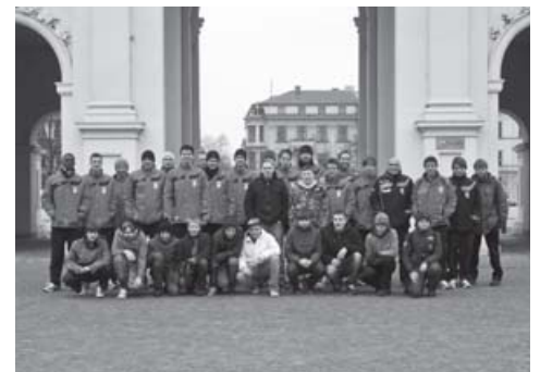
U16-Fahrt zum Spiel SV Babelsberg 03 gegen RWE – Fans trafen die Mannschaft am Brandenburger Tor.

„Offen-Dialogisch-Kompetent“ so lautet das Leitmotiv des Trägers, das ebenfalls in die tägliche Arbeit mit Fußballfans einfließen soll, um die Fanszene in Erfurt bestmöglich zu unterstützen. Fußball dient dabei als verbindendes Element: tolerant, fair und mit viel Leidenschaft zum Spiel – „Gemeinsam für Erfurt!“