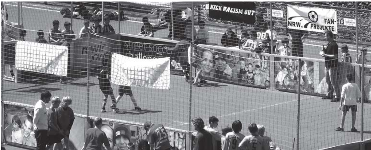
Das Streetkickturnier aller NRW-Fanprojekte unter dem Motto „Kick Racism Out“ gastierte auch in Wuppertal.