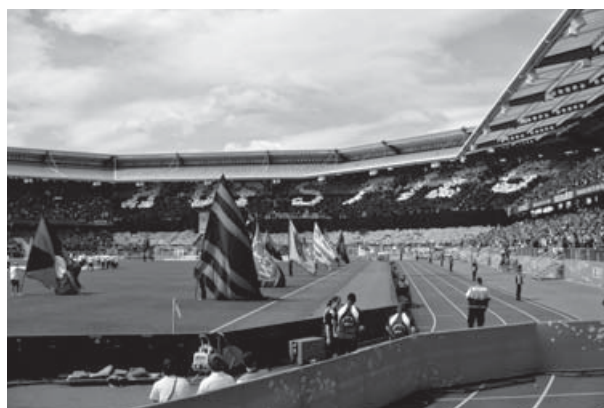
Die Nürnberger Ultras gehören zu den größten Gruppen in Deutschland.

Das Nürnberger Fanprojekt ist eine höchst lohnenswerte jugendpolitische Investition, die weiterer personeller und finanzieller Aufstockung bedarf. Vergessen sollte man dabei nicht, dass der 1. FC Nürnberg bundesweit eine der größten Fanszenen anzieht. Hier sollten im Interesse einer adäquaten gewaltpräventiven Fanarbeit sicherlich größere Anstrengungen von städtischer Jugendhilfe und Landesregierung unternommen werden.