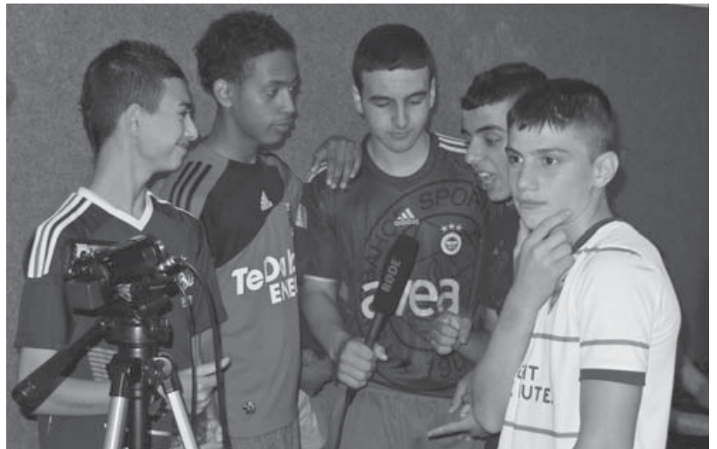
Jugendliche des Medienprojekts im Modul „JuMixx“

Seit Ende 2009 wird der OstKurvenSaal zudem als Lernzentrum genutzt. Mit Unterstützung der Robert Bosch Stiftung und der Bundesliga-Stiftung sowie in enger Kooperation mit Werder Bremen werden Unterrichtseinheiten