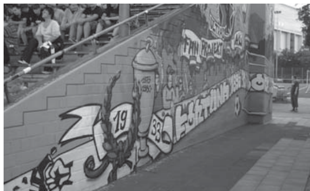
Fanprojektgraffiti im Flinger Broich

dorf, die in enger Zusammenarbeit mit Fanszene, Verein und Stadt seit Jahren durchgeführt werden. Die örtliche Stadionordnung wurde, u. a. aufgrund der Initiative des Fanprojekts, sehr frühzeitig durch die Aufnahme eines Antirassismusparagrafen modifiziert. 2011 holte das Fanprojekt Düsseldorf die Ausstellung Tatort Stadion 2 nach Düsseldorf und organisierte diverse Veranstaltungen zu Themen wie Homophobie und Sexismus.