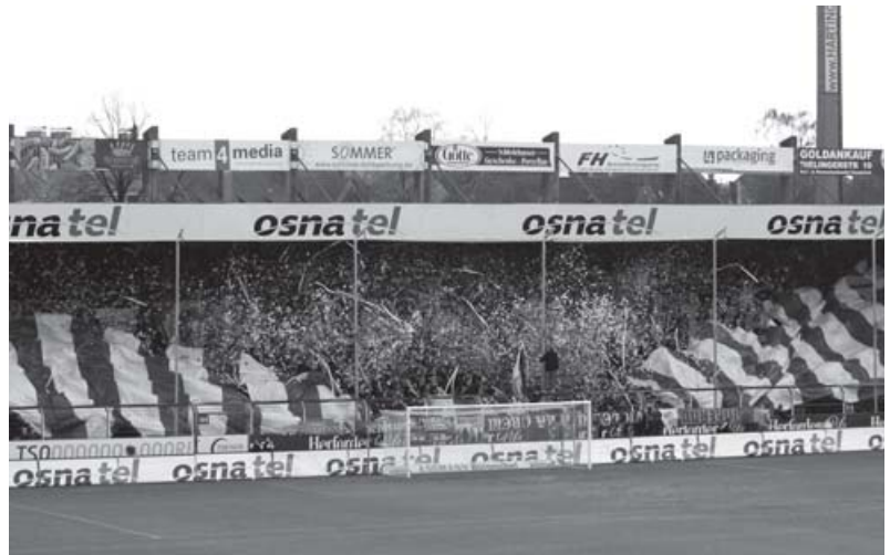
Die erste U16-Fahrt des Fanprojekts ging nach Oberhausen.

Zum Start des Fanprojekts lag der Arbeitsschwerpunkt der Mitarbeiter zunächst darauf, das Fanprojekt und seine „Gesichter“ in der Fanszene des VfL bekannt zu machen. Dabei war sicherlich hilfreich, dass vor allem die aktive Fanszene schon im Vorfeld einem Fanprojekt aufgeschlossen gegenüber stand und die Einrichtung befürwortete. Besonders hinsichtlich des Themas Stadionverbote und der transparenten Ausarbeitung von Anhörungs-/Bewährungsmodellen bei Stadionverbotsverfahren engagiert sich das Fanprojekt stark. Auch die Etablierung bei den organisierten