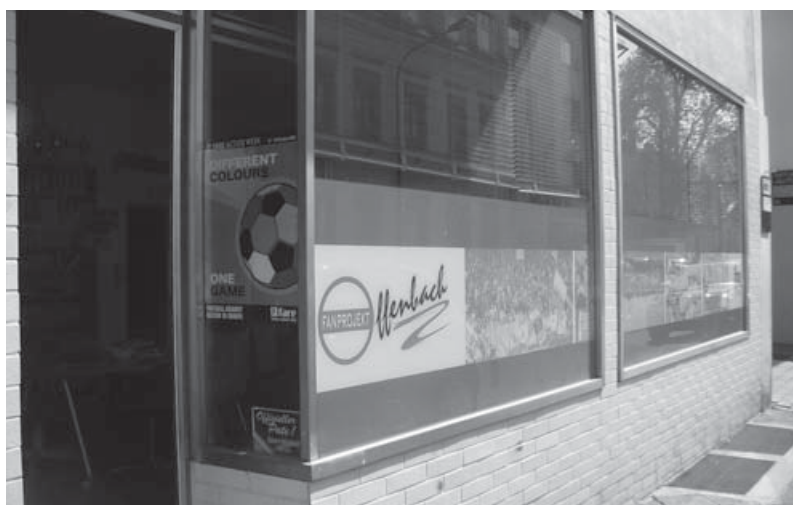
Der Fanladen in der Offenbacher Innenstadt dient als Büro und Raum für kleine Veranstaltungen.