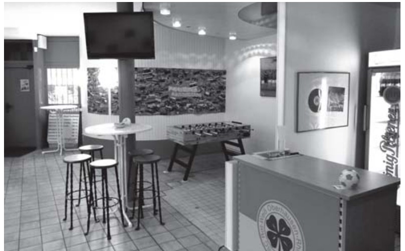
Die Fanprojekträumlichkeiten sind zentral in der Stadt gelegen.

quenter oder Delinquenz begünstigender Verhaltensweisen