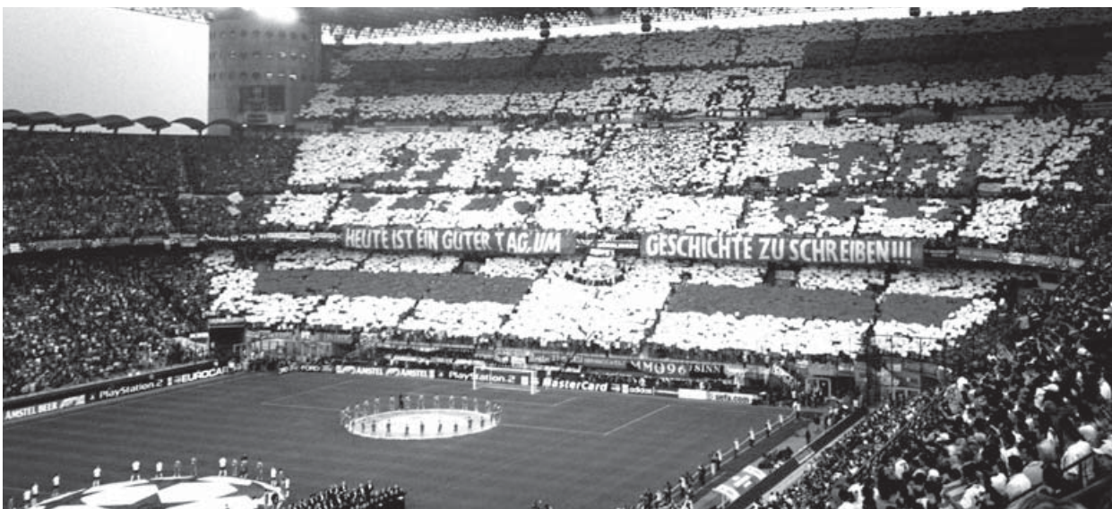
Eine Choreo der Roten

Am 18. Mai 2011 wurde aufgrund eines Antrages der Stadtratsfraktion Bündnis 90/Die Grünen im Kreisverwaltungsausschuss des Stadtrates die Gründung des Örtlichen