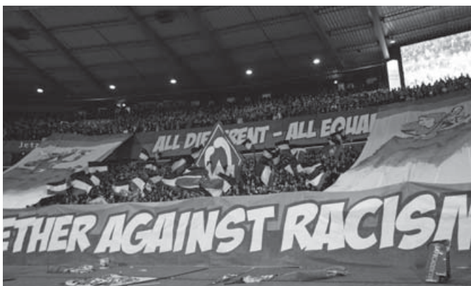
Choreo der Arbeitsgruppe Werderfans gegen Diskriminierung

Ein weiterer Arbeitsschwerpunkt ist die Mädchenarbeit, die in Bremen mit wichtigen Impulsen versehen wurde und sicherlich Modell für andere Mädchenarbeitsinitiativen in den vorherrschend männlichen Fanszenen (und Fanprojekten) sein kann, zumal immer mehr Mädchen und junge Frauen den Fußball für sich erobern. Hinzu kam in den letzten Jahren die Ausweitung der Fanarbeit in die Regionalliga, da sich auch die Amateurspiele einer zunehmenden Anhängerschaft, insbesondere aus der Ultraszene, erfreuen. Außerdem gibt es ein festes Fußballangebot für Jungen und Mädchen, das regen Zulauf verzeichnet. Hinzu kommt unser individuelles Beratungsangebot insbesondere bei Stadionverboten: Fans können durch ehrenamtliche Arbeit bei Werder oder beim Fanprojekt Bremen Stadionverbote auf Bewährung bekommen.