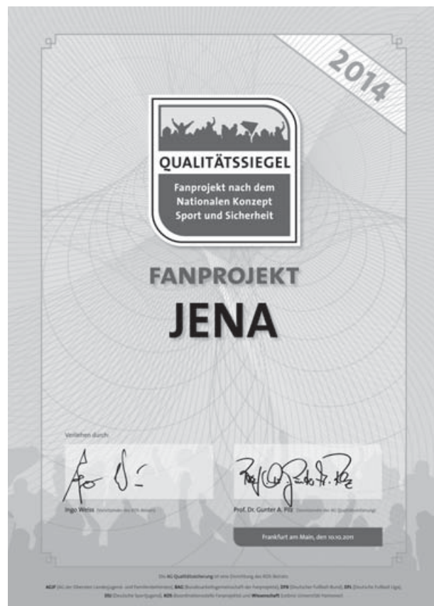
Die Einführung des Qualitätssiegels stärkt die Arbeit der Fanprojekte.

beiter/innen dieser Projekte können langfristige und stabile Prozesse in der jugendlich dominierten Fanszene in Gang setzen und begleiten, die zu einer Stärkung der positiven Fankultur beitragen. Seit 2010 befinden sich die Fanprojekte nun in diesem Prozess zur Sicherung der Qualität ihrer Arbeit. Schon nach dieser recht kurzen Spanne lässt sich das Fazit ziehen, dass die Einführung des Qualitätssiegels ein wichtiger Schritt zur rechten Zeit war, was durch die Aufnahme des Konzepts Qualitätssiegel Fanprojekt nach dem NKSS in die Ende 2011 aktualisierte Neufassung des Nationalen Konzepts Sport und Sicherheit noch einmal unterstrichen wurde.