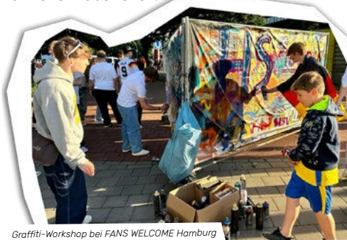
Graffiti-Workshop bei FANS WELCOME Hamburg

Wir sind mächtig stolz auf das, was wir auf die Beine gestellt haben, und hoffen, dass wir zeigen konnten, wie wichtig es ist, uns Expert*innen vor Ort ins Turnier einzubeziehen.