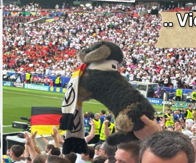
.. Viertelfinale in Stuttgart.