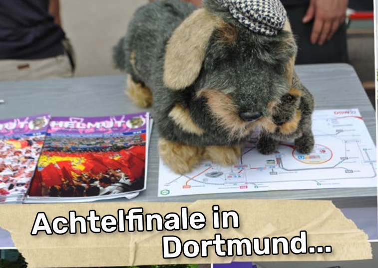
Achtelfinale in Dortmund...