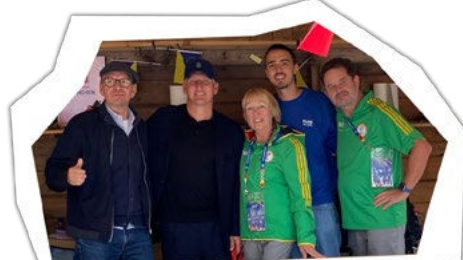
Bastian Schweinsteiger besucht FANS WELCOME München

Von Fan-Matches, zum Beispiel in Leipzig und Paderborn, über Graffiti-Workshops in Hamburg und Köln bis hin zu Diskussionsrunden in Berlin: Es wurde getanzt, gesungen und bei Tischkicker-Turnieren der eine oder andere Champion gekürt. FANS WELCOME wurde zu einem Ort der Begegnung, inklusive netter Plaudereien und tollen Menschen aus den internationalen Fanbotschaften. Außer-