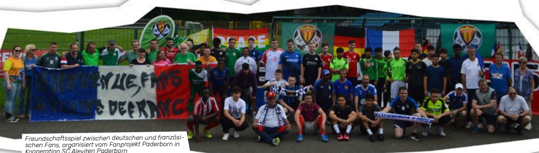
Freundschaftsspiel zwischen deutschen und französischen Fans, organisiert vom Fanprojekt Paderborn in Kooperation SC Aleviten Paderborn