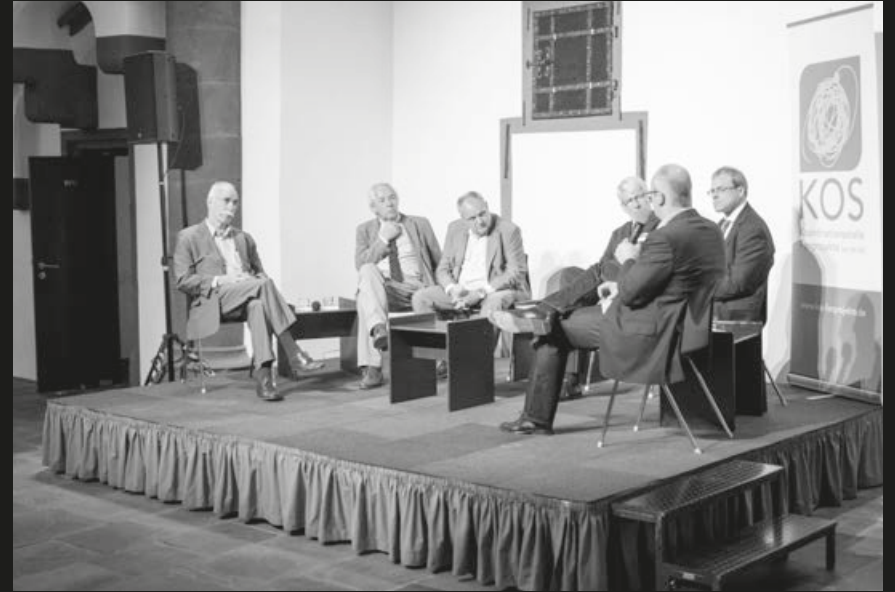
Podiumsdiskussion „20 Jahre Nationales Konzept Sport und Sicherheit, 20 Jahre KOS“ im Römer