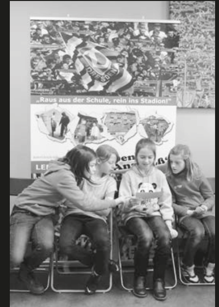
Lernzentrum „Denk-Anstoß“ Dresden