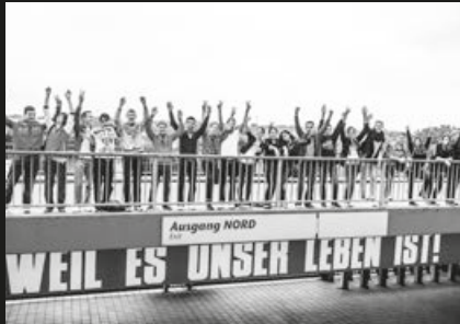
Schalke macht Schule