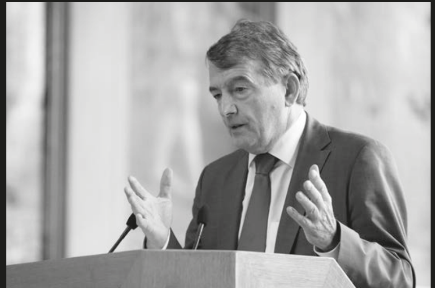
Wolfgang Niersbach (DFB-Präsident)