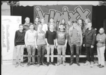
Lernzentrum OstKurvenSaal Bremen, JuMixx-Stadionschule