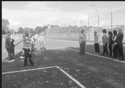
Lernzentrum OstKurvenSaal Bremen, JuMixx-Filmprojekt