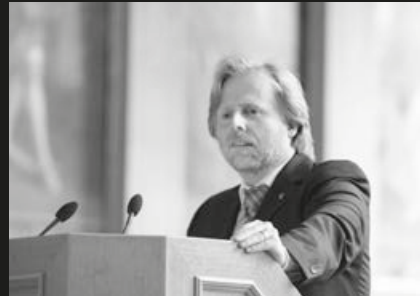
Olaf Cunitz (Bürgermeister der Stadt Frankfurt am Main)