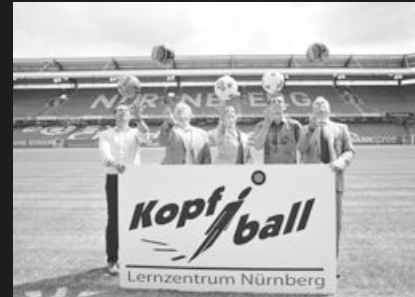
Eröffnung in Nürnberg, Foto: Fanprojekt Nürnberg