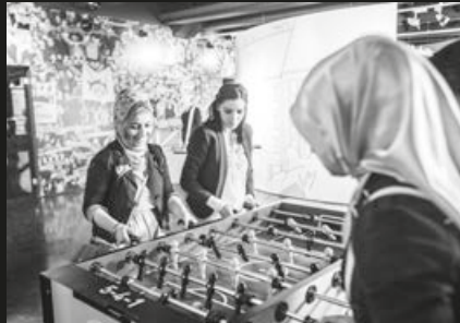
Lernzentrum Dortmund