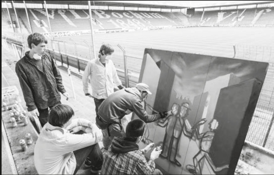
Bochum „Soccer meets Learning“