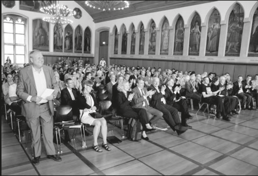
Empfang im Kaisersaal des Frankfurter Römer