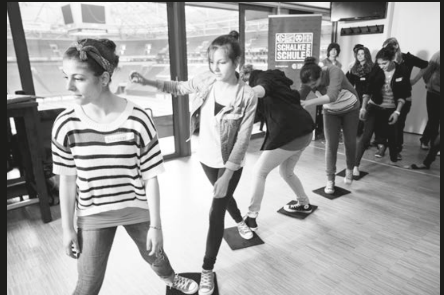
Schalke macht Schule