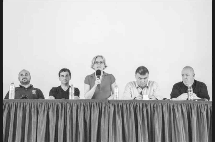
Podiumsdiskussion „Der internationale Blick – Fanarbeit in Europa“