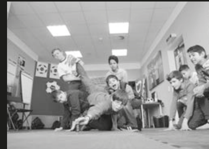
Lernzentrum „Denk-Anstoß“ Dresden