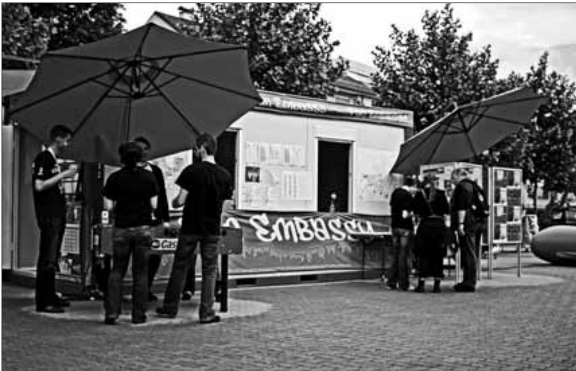
Informationen der gastgebenden Fanbetreuung erhielt man an den Fanbotschaften, hier die Fanbotschaft in Klagenfurt.

Neben dem Internetangebot bot auch die Fanbetreuung der Gastgeberländer etwas „Handfestes“ zum Lesen. Es wurden kleine lokale Fanguides produziert, die detaillierte Infos zu den jeweiligen Host Cities lieferten und an den dortigen Fanbotschaften in den jeweils benötigten Sprachen verteilt bzw. auch zum Download auf der Website angeboten wurden. Insbesondere die Berücksichtigung „exotischer“ Sprachen wie Rumänisch oder Schwedisch sorgte bei den Fans aus diesen Ländern für viel positive Resonanz.