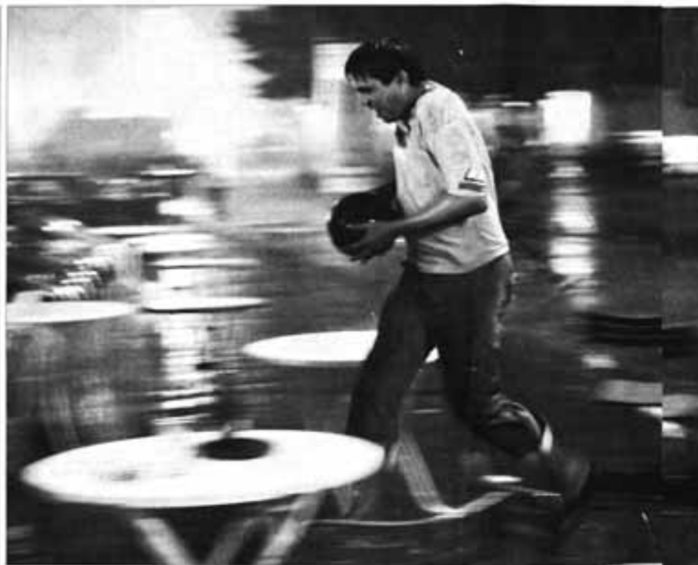
Eine EM für Wasserschlächtenbummler: Beim Public Viewing in Wien war bisweilen gute Stimmung, aber sehr selten gutes Wetter.

Die Österreicher haben gegen Deutschland nicht gewonnen, er haben den alten Traum und das ewige Trauma Córdoba nicht ersetzen können durch ein neues Wunder. Er war schlimmer, und es kam noch schlimmer. Die Deutschen können ja sofort ins Finale kommen, aber ausge-