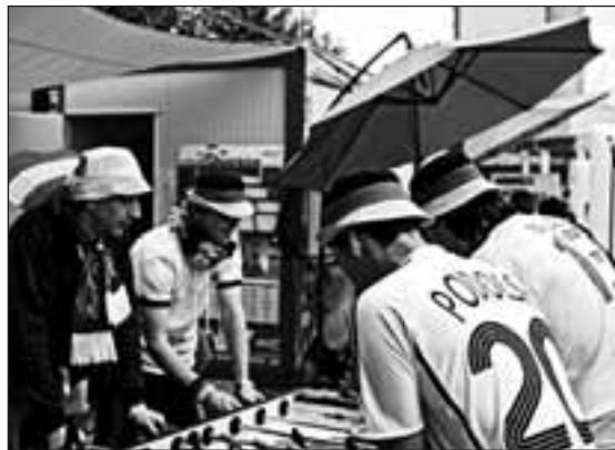
Weltweit beliebt: Tischfußball

Als Ausdruck ihres antirassistischen Engagements zur EURO hat die UEFA zudem die beiden Halbfinalspieltage dem Kampf gegen Rassismus gewidmet und dies mit entsprechenden Kampagnen im Stadion begleitet.