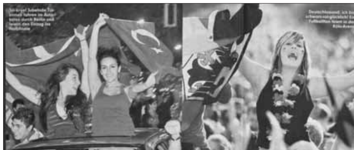
Im Ernst! Schokolade für jeden haben im Ruhrgebiet steht Berlin und lassen den Freitag im Halbfinale