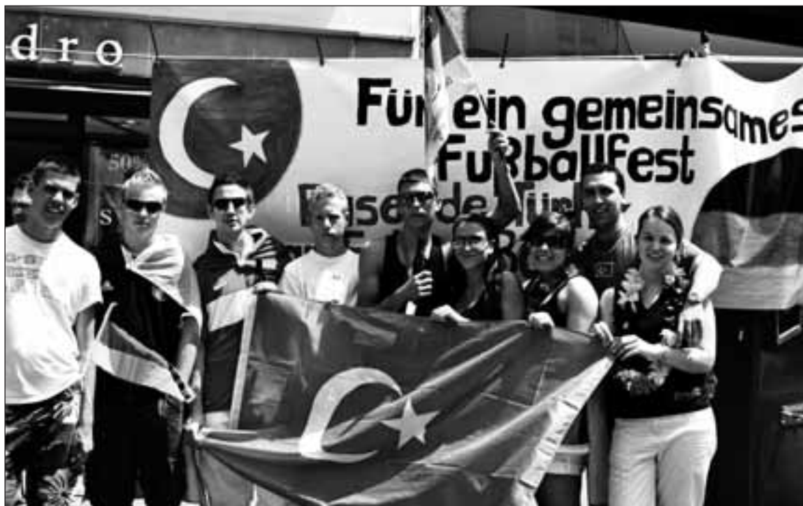
Freundschaftliche Szenen prägten in Basel den Tag.

gruppen werden wir zum Halbfinale in Basel gemeinsam an einem Ort für euch da sein. Wie schon beim Viertelfinale findet ihr uns – und natürlich das feuerrote Fanmobil – ab Dienstagmittag in der Basler Innenstadt auf der Freien Straße Ecke Kaufhausgasse. Wir werden euch dort gemeinsam mit den sieben türkischen Kollegen mit Rat und Tat zur Seite stehen, türkische Fanguides und einige wenige Restexemplare unseres deutschen Guides sowie Informationen zum Spielort Basel verteilen. Geöffnet ist die deutsch-türkische Fanbotschaft am Dienstag von 13 bis 19 Uhr und am Spieltag selbst von 11 bis 20 Uhr. Auch nach Abpfiff des Spiels sind wir aber natürlich ansprechbar und vor Ort.