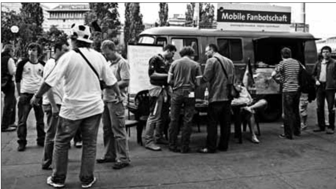
Die Anlaufstelle lag günstig am Ende einer Flaniermeile und am Eingang zur U-Bahn.