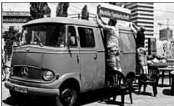
Aufbau in Wien