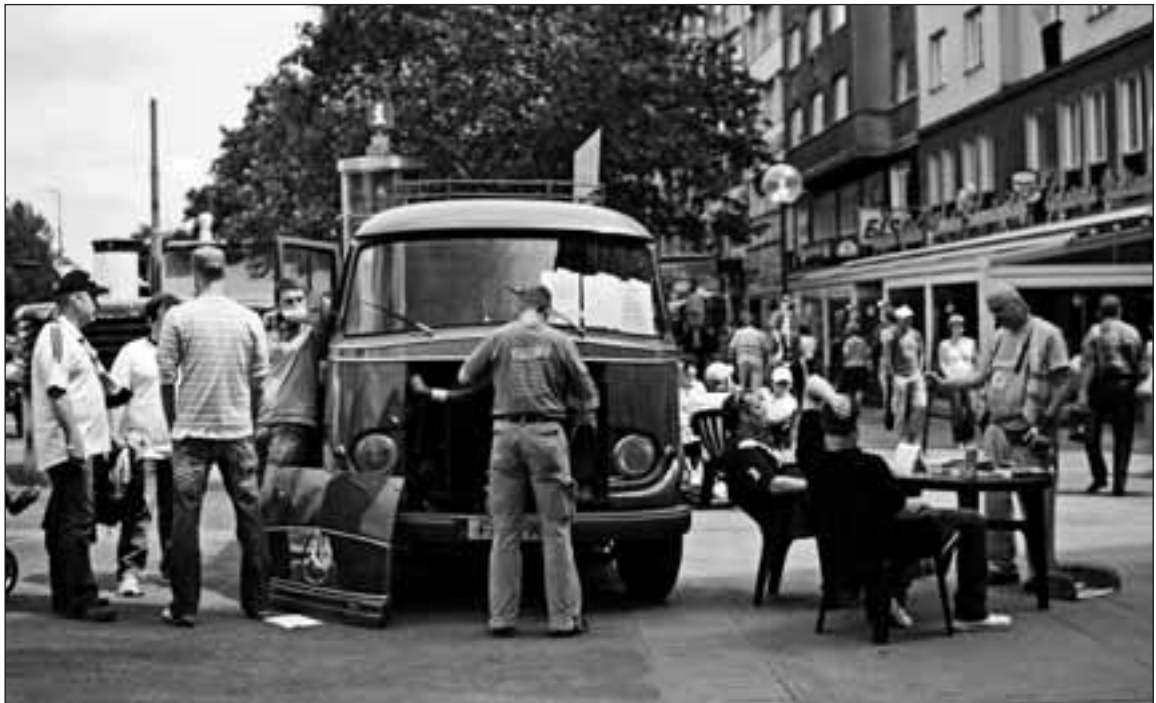
Ab und an brauchte unser feuerrotes Fanmobil fachkundige Wartung.

Zur Vorgeschichte: Im Jahre 2003 hatten wir vom Frankfurter Fanprojekt das alte Gefährt in schrottreifem Zu-