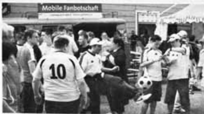
Fan-Botschaft im Belagerungszustand.

Diese Stimmung wünscht sich das KOS-Team auch rund um das Spiel Deutschland gegen Österreich. Ihr Feuerwehrbus wird am Schwedenplatz in Wien stehen. Auf Flyern geben die Helfer in Sachen Fanfragen auch eine Handynummer bekannt, die die Anhänger – im Notfall – jederzeit anrufen dürfen. Wobei Gabriel und seine Kollegen mit ihrer Klientel anscheinend nicht ausschließlich gute Erfahrungen gemacht haben. Im Flyer heißt es: „Aber bitte nicht nachts um drei anrufen und fragen, wer morgen im Sturm spielt.“