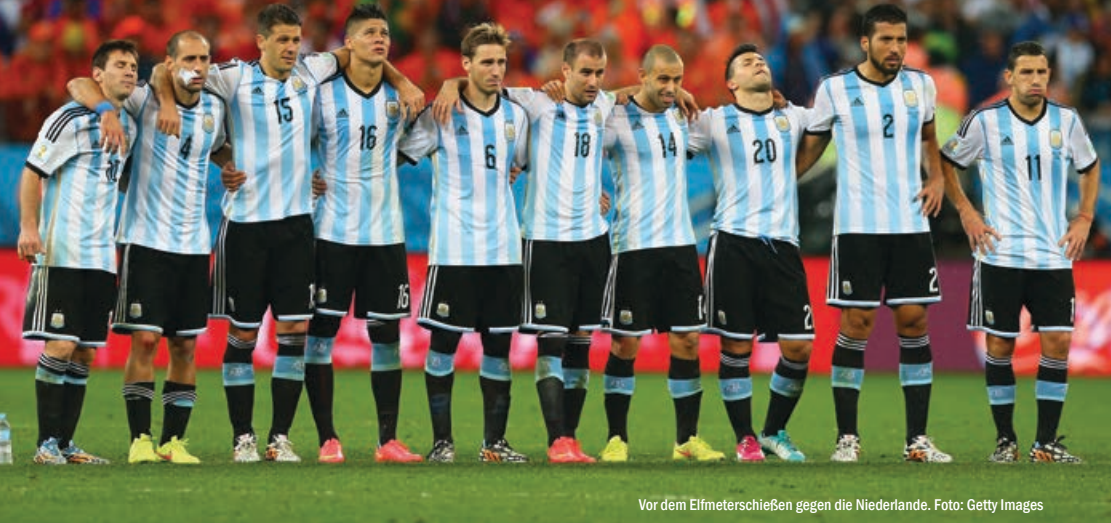
Vor dem Elfmeterschießen gegen die Niederlande.